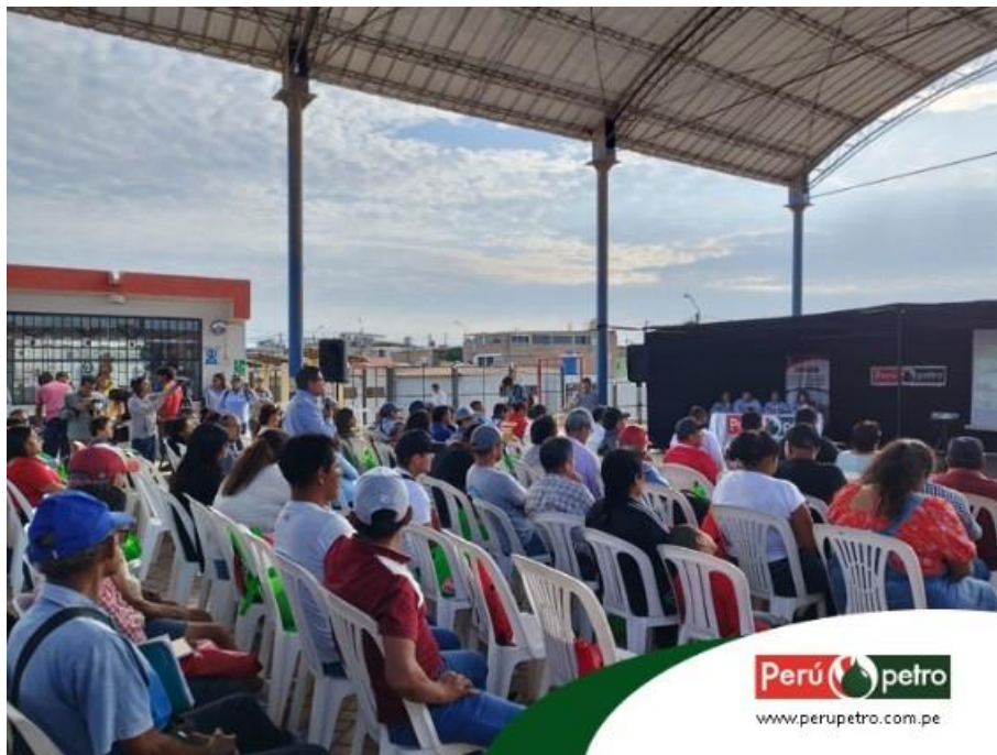
Foto N°2: Evento Presencial de Participación Ciudadana en la Brea por el Lote VII – 14 de diciembre de 2023

A las 4:10pm se dio inicio al Evento Presencial de Participación Ciudadana que estuvo a cargo de los representantes de PERUPETRO y OLYMPIC.