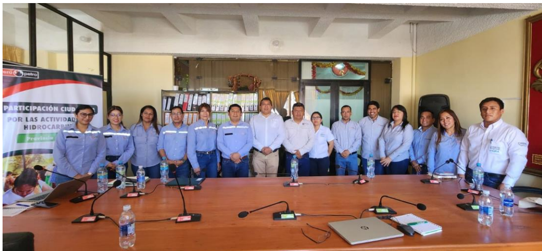
Foto N°1: Reunión previa de coordinación en la Municipalidad Provincial de Talara

Las reuniones de coordinación se llevaron a cabo contando con la participación de representantes de GSGA, PRCO, SUPC y LEGAL de PERUPETRO, así como representantes de la Gerencia de Relaciones Comunitarias, Comunicaciones y Desarrollo Sostenible de OLYMPIC.